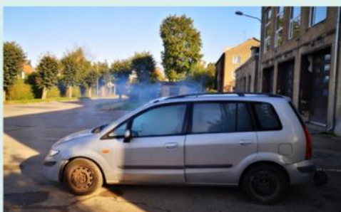
1. Apstājies, noslāpē automašīnas