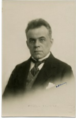
Latvijas Republikas pirmais iekšlietu ministrs un ievērojams sabiedriski politiskais darbinieks Miķelis Valters (1874 - 1968)